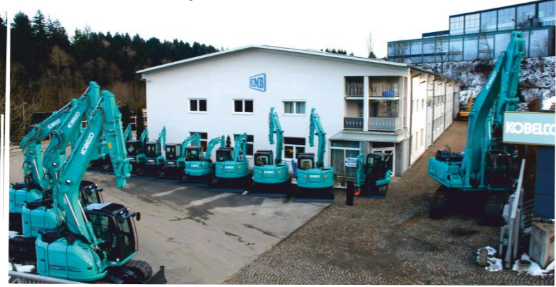
Hauptsitz Neukirchen vorm Wald

Fragen Sie um Sonderpreise und Austauschteile: