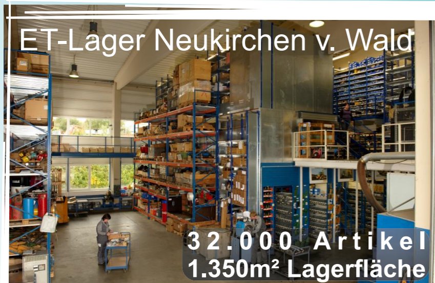
ET-Lager Neukirchen v. Wald